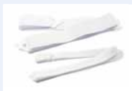
SB 52 en SB 25