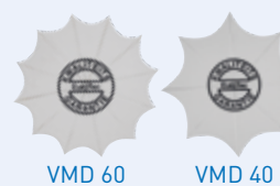
VMD 60 VMD 40